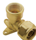
Γωνία με στήριγμα Art 406