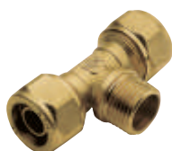
Ταψ αρσ. Art 408