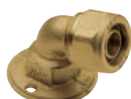
Γωνία υδροληψίας Art 418