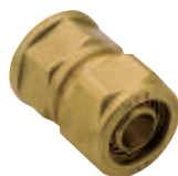
Ρακόρ θηλ. Art 402