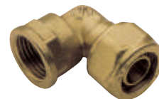
Γωνία θηλ. Art 405