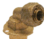
Γωνία υδροληψίας με λαιμό Art 428p PR