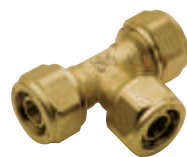
Ταψ σύνδεσης Art 407