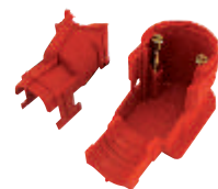
Διαιρούμενη θήκη NOVA Art 490