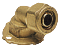
Γωνία υδροληψίας Art 428p