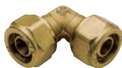
Γωνία σύνδεσης Art 403