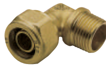
Γωνία αρσ. Art 404