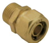
Ρακόρ αρσ. Art 400