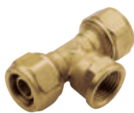
Ταψ θηλ. Art 409