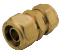
Ρακόρ σύνδεσης Art 401